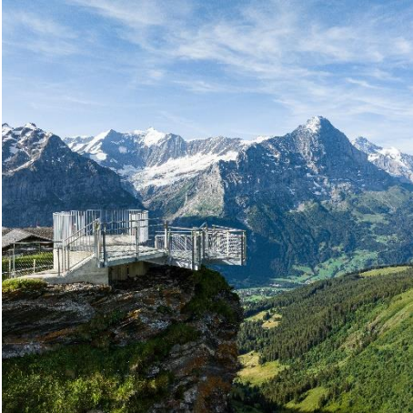
Plate-forme «First View»

Située au sommet du Mont First, la plate-forme panoramique « First View » offre une vue à couper le souffle sur les Alpes bernoises. Arrivés à la station supérieure, à plus 2168 mètres d'altitude, les visiteurs marcheront encore quelques mètres pour atteindre la fameuse plate-forme panoramique en métal. Sept points de vue différents et époustouffants sur la couronne alpine variée de l'Oberland bernois s'offrent à eux. Les intrépides à la recherche de sensations fortes ne seront pas en reste et pourront prendre du plaisir sur le First Cliff Walk présenté par Tissot ou sur les variantes de flying-fox «First Flieger» et «First Glider».